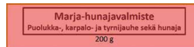
Kuva 2. Hunajavalmisteeseen, jossa on useita eri marjoja, merkitään käytetyt marjat nimen alle.

Pakkaukseen laitetaan usein myös säilytysohje, käyttöohjeita ja -vinkkejä sekä tarinaa tuotetta valmistavasta yrityksestä käytettävissä olevan tilan mukaan.