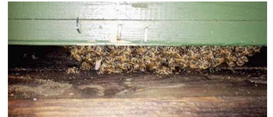
Talvipallo lentoaukolta katsottuna alhaalle eteen asettuneena niin kuin kuuluukin.

Viime talvena Pohjois-Suomessa mm. kuoli pesiä, kun aivan tarhan vieressä oli tehty jäiseen maahan kaivuutöitä. Muuta järkevää selitystä ei löytynyt. Ainoa keino näissä tapauksissa on, että tarha näkyy, vaikka olisi lumen peittämää. Riskialtiilla alueella kannattaa merkata lumen alle jäävä tarha jollakin selkeällä tavalla.