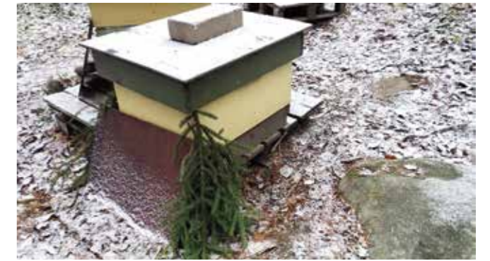
Ratkaisuksi voi riittää havut, jotka peittävät aukon.