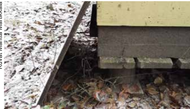
Pesän edustalle asetetun levyn ja lentoaukon väliin jää talitiaisen mentävä aukko.