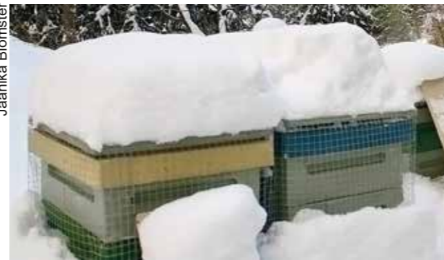
Tikkasuojaksi voi virittää metalliverkon. Säkki ja verkko estävät myös muiden lintujen häiriköinnin.